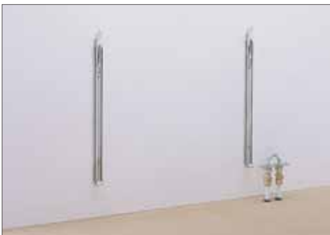
5. Nach Maler- oder Fliesenlegerarbeiten Heizkörperaufhängungen montieren und bei abgesperrtem Kugelhahn das Verbindungsstück entfernen.