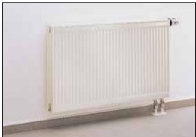
6. Installation des Heizkörpers.