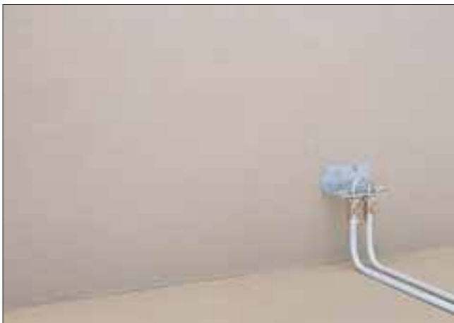
3. Montieren der Absperreinrichtungen, Anschliessen der Heizrohre und Abdrücken des Systems.