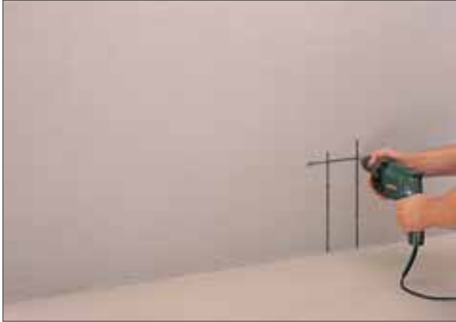
1. Befestigungslöcher für die Montageschablone anzeichnen und Ø 10 mm bohren (hier Anschluss rechts).